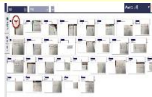
「ムーブノート」を活用した指導（個の予想の共有）