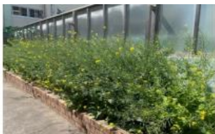
こん虫を呼び寄せるための観察園の整備