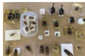
様々なこん虫標本の作成