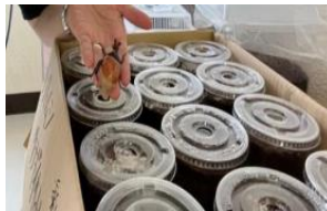
教室にカブトムシのさなぎコーナーを設置